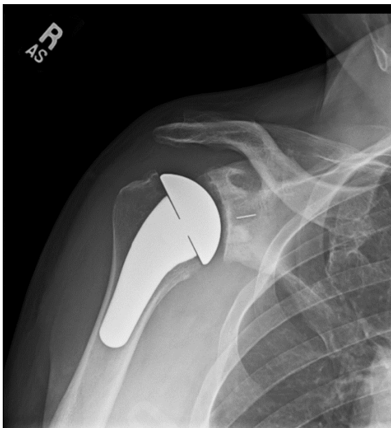
Artroplastia Total de Hombro (reemplazo)

El Dr. Chudik realiza una incisión limitada en la parte delantera del hombro y trabaja a través de intervalos en los músculos del hombro y el pecho para poder revestir el húmero (bola) y la cavidad glenoidea. Estas superficies desgastadas se sustituyen por componentes metálicos y plásticos especiales que se ajustan a su hombro..